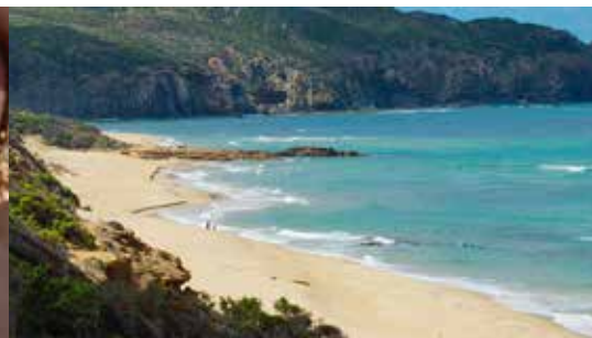
Eindrücke vom Südwesten