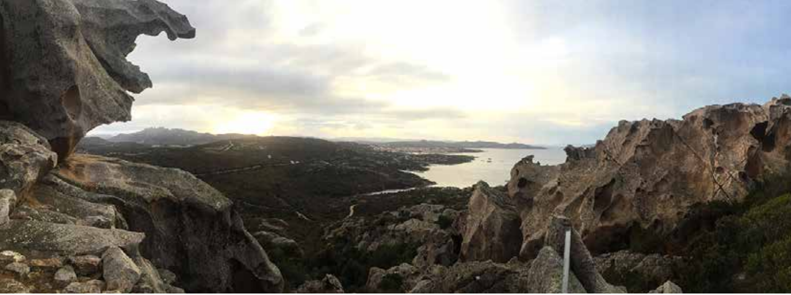
Panorama über Palau