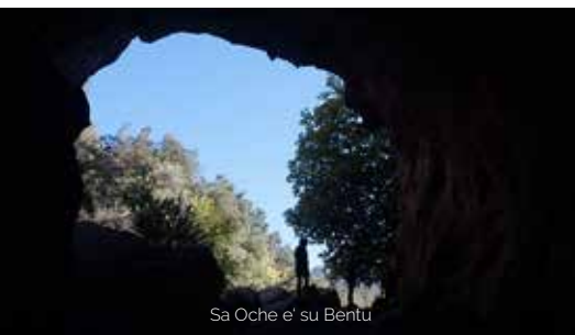
Sa Oche e' su Bentu

Wir fahren dann in das wunderschöne Tal von Lanaittu. Auf unserer Entdeckungsreise wirst du das Gefühl haben, dass die Zeit hier seit tausenden von Jahren stehen geblieben ist. In diesem mystischen Tal besuchen wir „Sa Sedda di Sos Carros“ die Höhle des Banditen „Su Corbeddu“ und Sa Oche de su Bentu die Stimme des Windes. Auf dem Rückweg besuchen wir die tiefste Wasserquelle von Sardinien und machen einen schönen Spaziergang entlang des Flusslaufs.