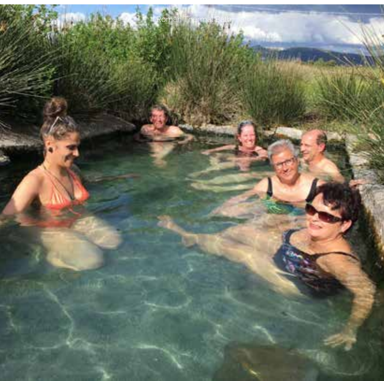
Roman Thermal Bath

Auf dem Weg zur Inselmitte haben wir nun zwei Möglichkeiten; wir besuchen eine nuraghische Therme und nehmen ein angenehmes warmes Bad oder wir besuchen das Sanktuarium von Santa Cristina, dem Heiligen Brunnen aus der Bronzezeit. Dann geht es weiter zu unserer neuen Unterkunft, dem Hotel Il Refugio di Su Gorropu. Es ist ein faszinierender Platz mit exzellenter einheimischer Küche und einem traumhaften Bergpanorama. Du erlebst hier einen Sternenhimmel der mit dem in der Wüste vergleichbar ist. Die älteste Familie der Welt lebt in diesen Bergen und in Europa die meisten über Hundert Jahre alten Menschen. Im Laufe der nächsten Tage werden wir deren Geheimnis lüften.