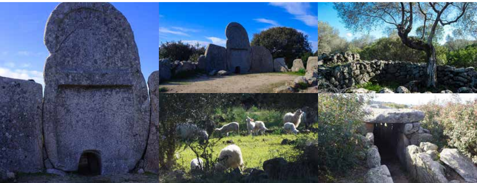
Tomba S'Ena e Thomes

Nach dem Frühstück checken wir aus und fahren in Richtung Westen. Sollte der Rückflug nicht in der Frühe sein, so besuchen wir auf dem Weg zum Flughafen das Gigantengrab Tomba S'Ena e Thomes oder i