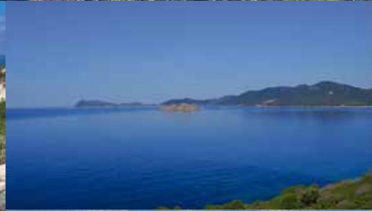
Fotos von der Costa del Sud