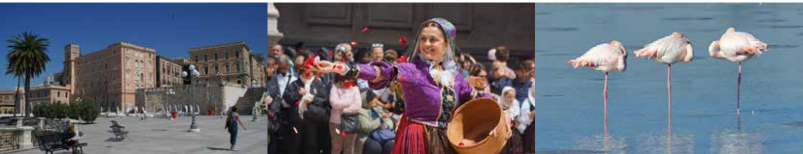
Fotos von Cagliari

Wir begrüßen dich am Flughafen Cagliari und bringen dich in die Unterkunft. Am Abend führen wir dich zum Abendessen aus um unsere kleine Reisegruppe kennen zu lernen.