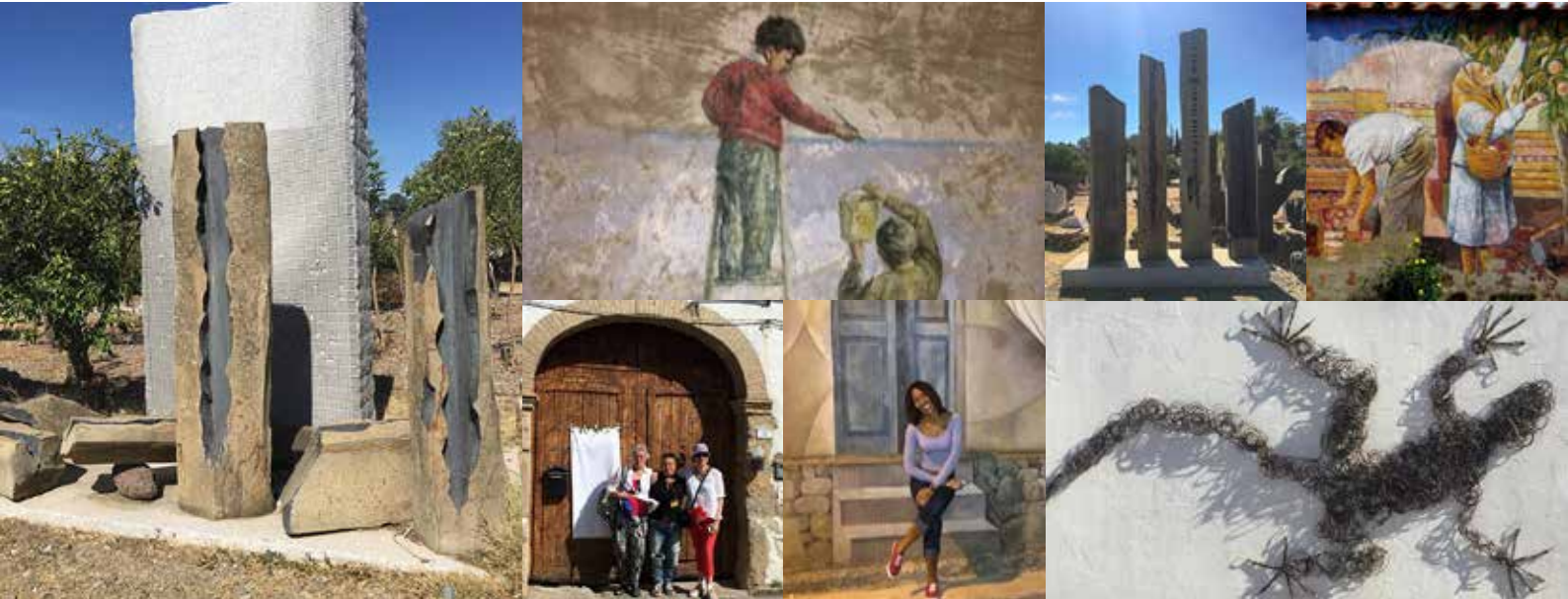
Fotos von San Sperate